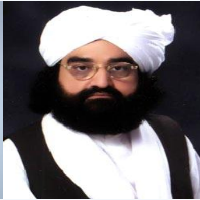
علامه پیر نصر الدین شاه گیلانی هند بریتانیا