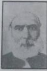
مريدنا الأقطاب الشيخ محمد عبد

١٤ من جمادى الآخرة ١٣٠١ هـ ١٠ من أبريل ١٨٨٤ م