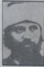
السير المستوفى جمال الدين الافغانى