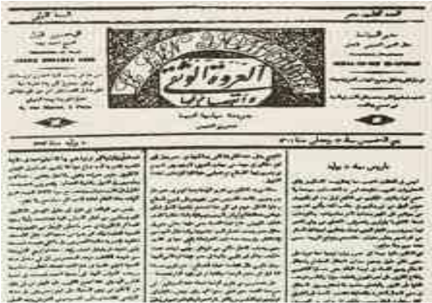
د العروة الوثقى د لومړی کڼه ، لومړی مخ