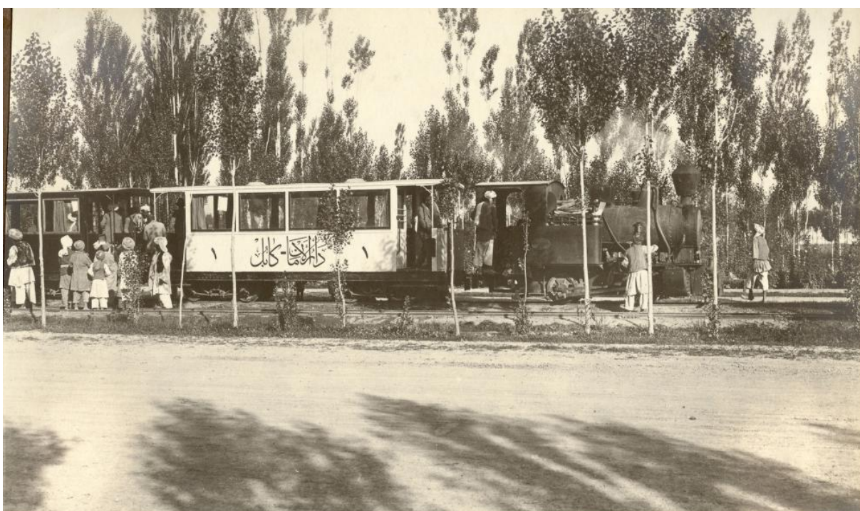
پیوست ۲/۵. فوتوی قطاری که بکمک آلمان در کابل با خط آهنی بدرزای ۷ کیلومتر ساخته شده و میان دارالامان و مرکز کابل در رفت و آمد بود.