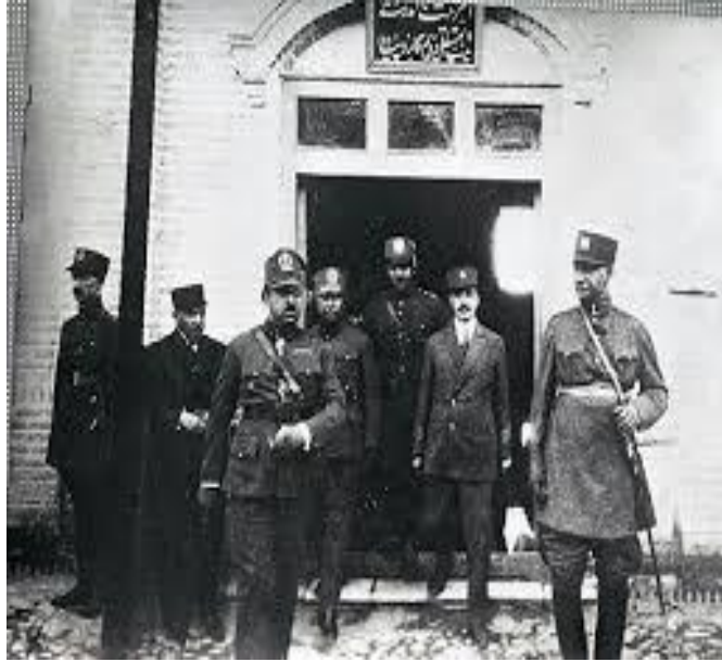
پیوست ۲/۹ عکس امان الله شاه با محمد رضا خان شاه فارس در سال ۱۹۲۸.