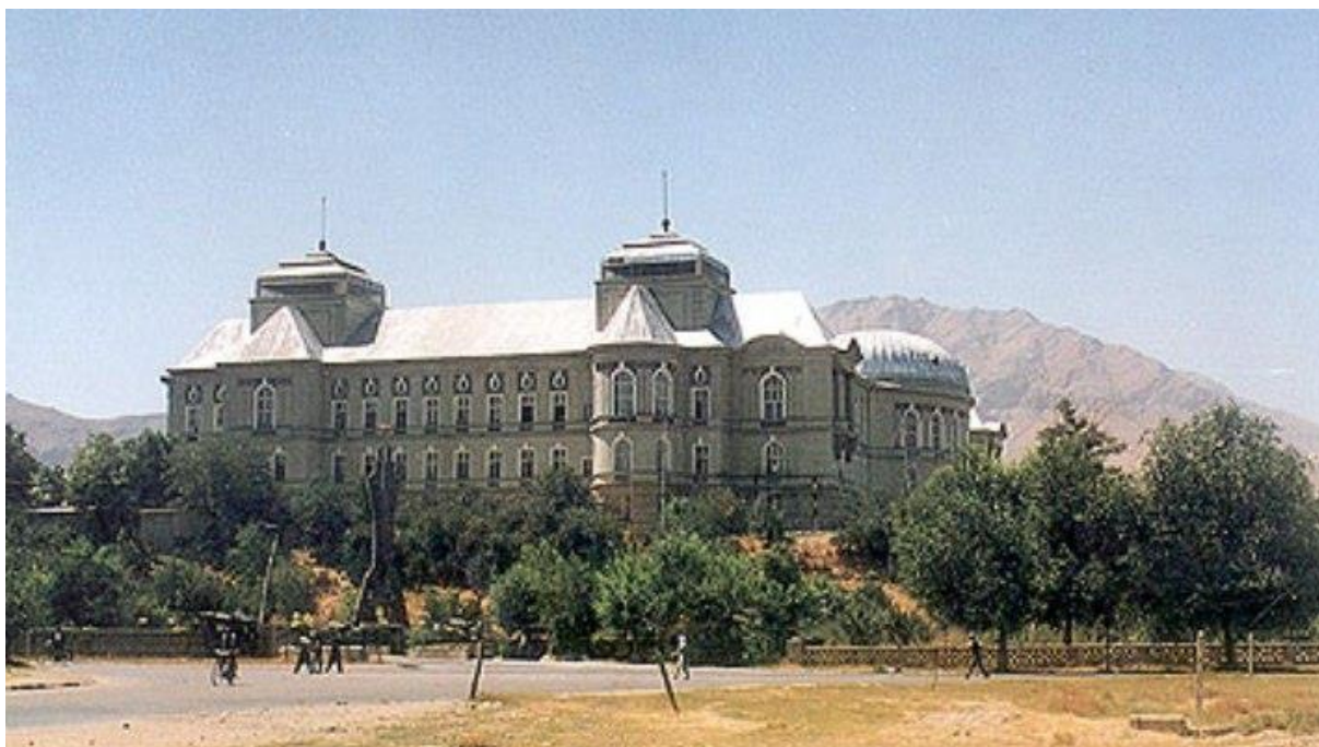
کاخ دارالامان که در آغاز سالهای بیستم قرن گذشته توسط مهندسان آلمانی ساخته شده بود. تصویر ۲/۴