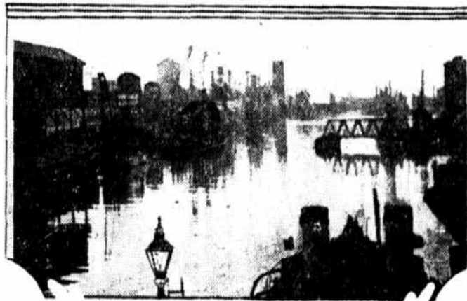
London, Wednesday ("Sun" Special)—King Amanullah of Afghanistan visited industrial works at Manchester. At the factory of Metropolitan Vickers Electrical Company he was shown the latest electrical devices. Later he journeyed down the Manchester ship canal. His launch carried the Afghan flag and each slip berthed in the canal dipped its colors as he passed. Cheering crowds lined the banks. (The above picture shows the famous canal).