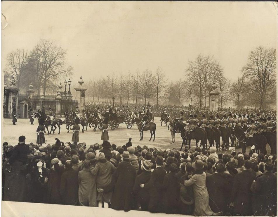
پیوست ۳/۳ امان الله خان در جریان سفر رسمی در لندن سال ۱۹۲۸ 3 King Amanullah in London in 1928