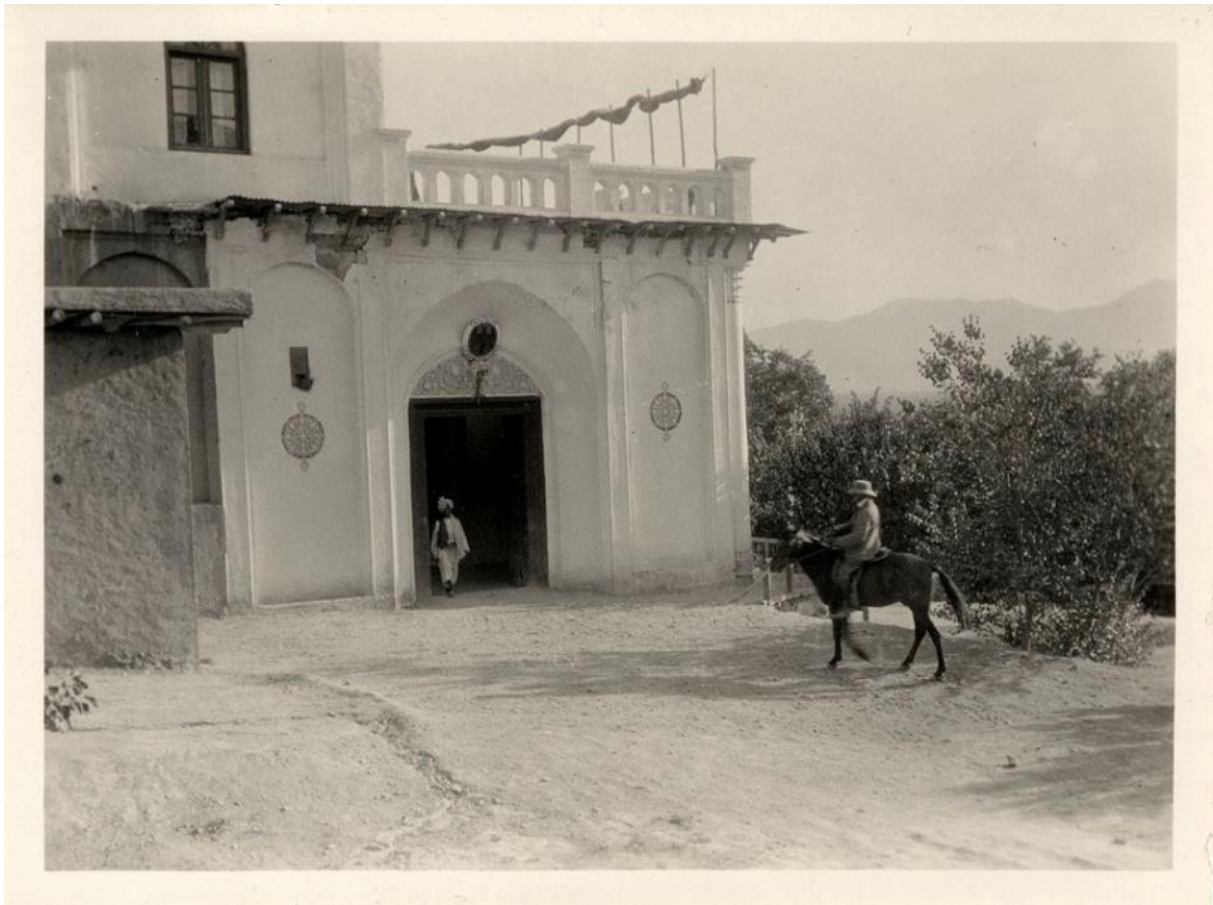
تصویر ۲/۸ ساختمان سفارت آلمان در کابل واقع در باغ بابری. عکس از مهندس هالندی ادریانوس فان لوتسنبورگ ماس.