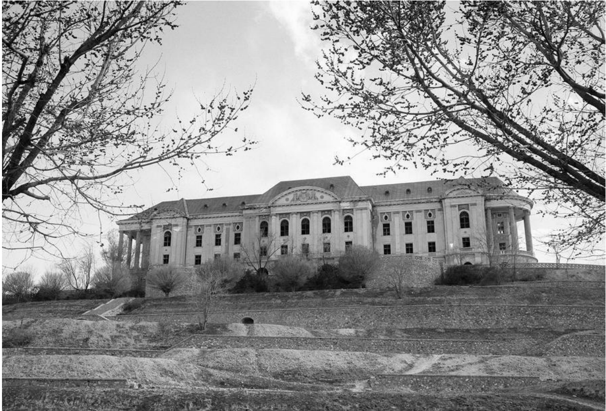
تصویر ۲/۶ کاخ تاج بیگ که همچنان یکمک مهندسان آلمانی ساخته شده بود.