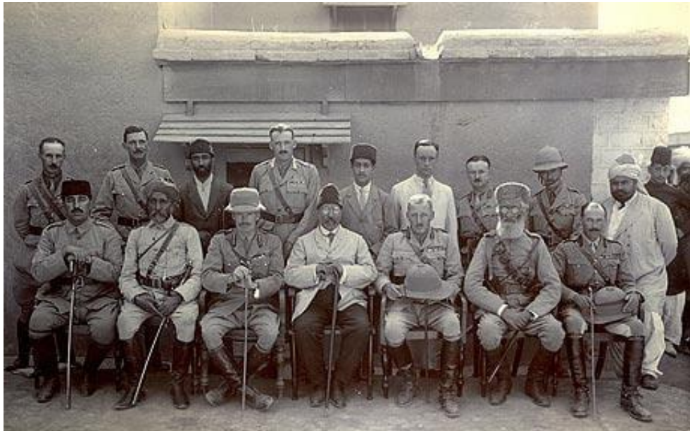
هیأت عقد معاهده «استقلال» افغانستان در هند برتانوی در راس محمود طرزی.