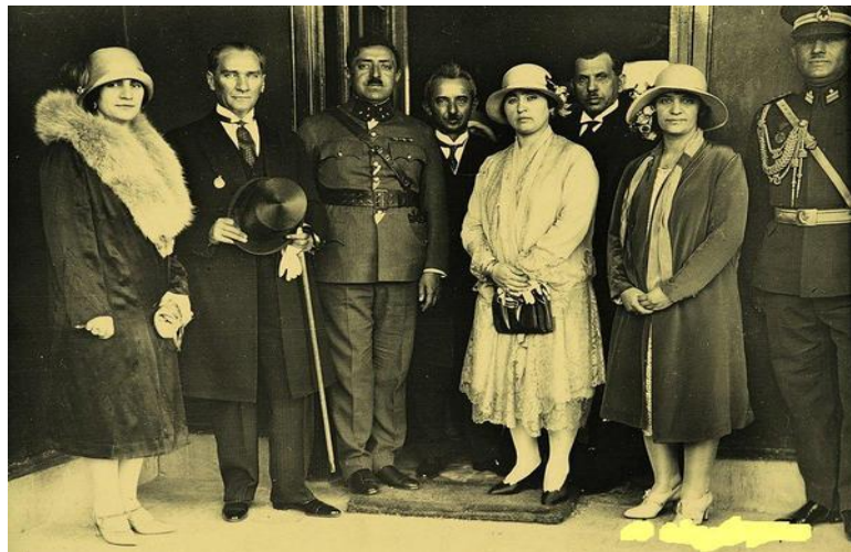
امان الله شاه و هیأت همراهش با مصطفی کمال اتاترک. سال ۱۹۲۸